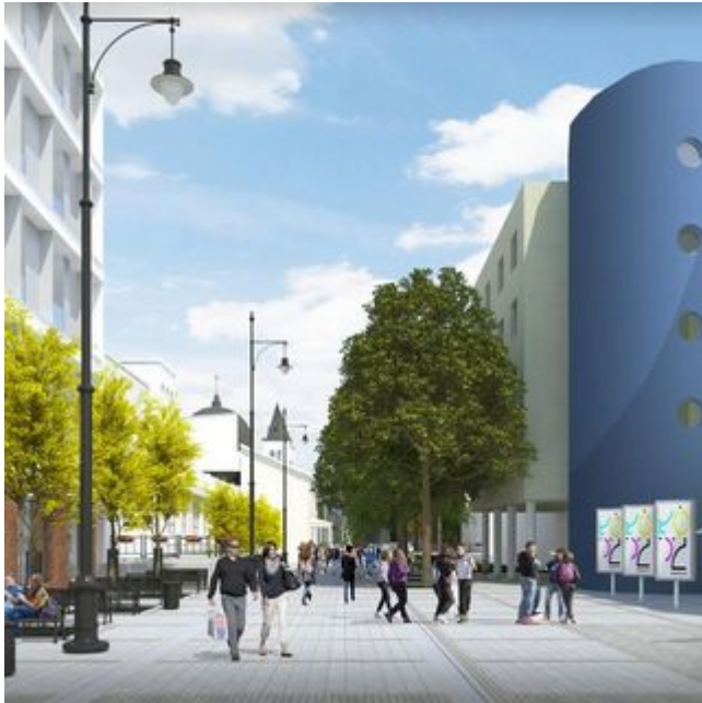
4 - PASAŻ RÓŻY WIZUALIZACJA OBSZAROWA CENTRUM ŁODZI