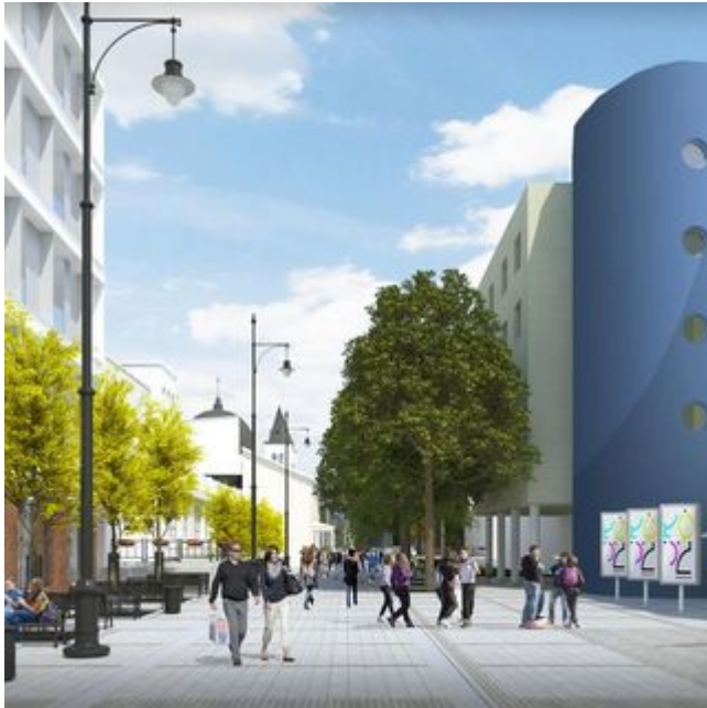
4 - PASAŻ RÓŻY WIZUALIZACJA OBSZAROWA CENTRUM ŁODZI WIZUALIZACJA NA PC FUNKCJONALNA