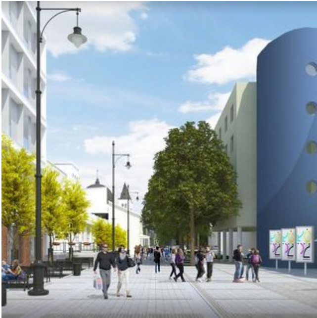
4 - PASAŻ RÓŻY