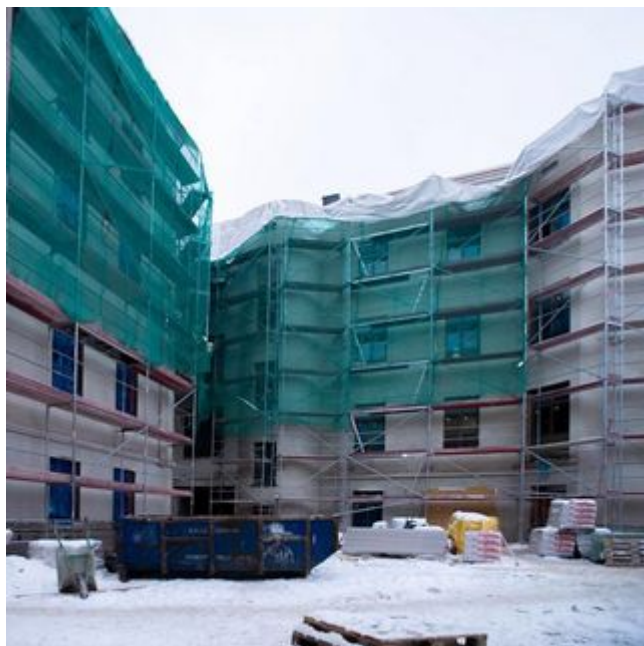
NAJBARDZIEJ ZIELONY ADRES W MIEŚCIE