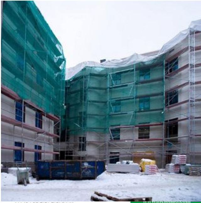
NAJBARDZIEJ ZIELONY ADRES W MIĘŚCIE