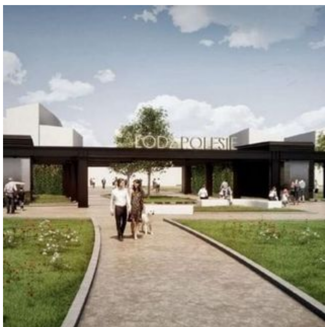
Startuje budowa stacji Łódź Polesie