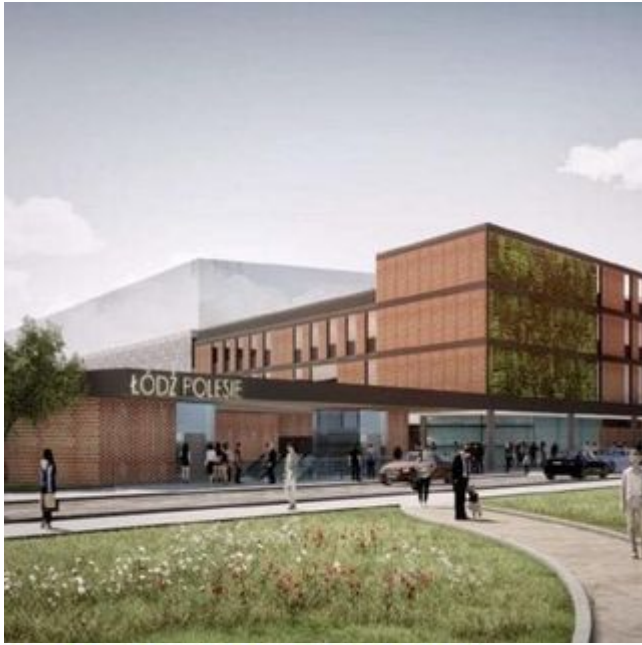
METRO | BUDOWA STACJI ŁÓDŹ POLESIE PRZECIĄGU OD 21 LUTEGO 2021 r.