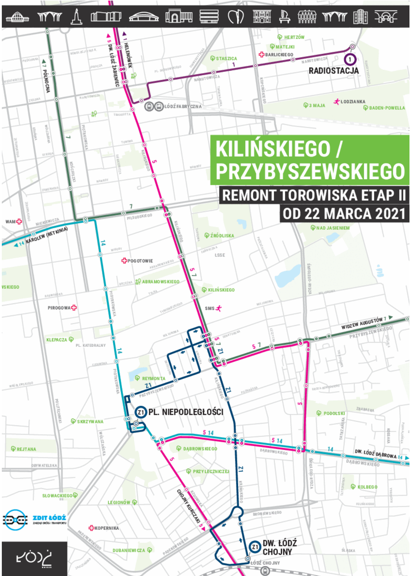
Remont torowiska na skrzyżowaniu Przybyszewskiego / Kilińskiego