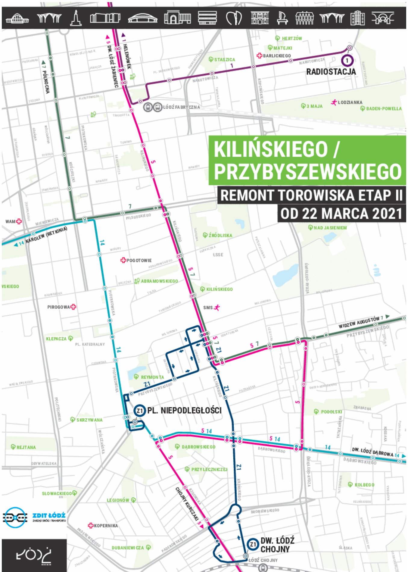
Remont torowiska na skrzyżowaniu Przybyszewskiego / Kilińskiego