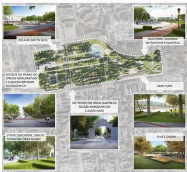
WIZUALIZACJA ZMIAN NA WYKONANE PRACOWNIKÓW FUNKCJONALNOŚĆ - 02/09/2016 3 2016