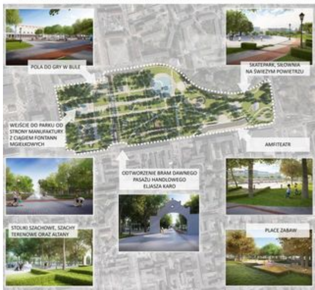
WIZUALIZACJA ZMIAN NA WYKONANE PRACOWNIKÓW FUNKCJONALNOŚĆ - 02/07/2018 3 2018