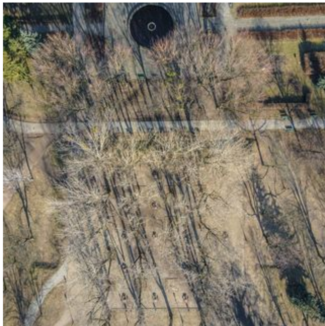
PROJEKT 4 - PARK STAROMIEJSKI REWITALIZACJA OBSZAROWA CENTRUM ŁÓDZI