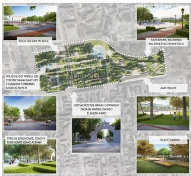
WIZUALIZACJA ZMIAN NA WYKONANE PRACOWNIKÓW FUNKCJONALNOŚĆ - OPRACOWANIE 2020...