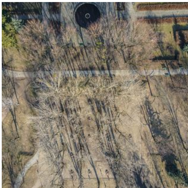
PROJEKT 4 - PARK STAROMIEJSKI REWITALIZACJA OBSZAROWA CENTRUM ŁÓDZI