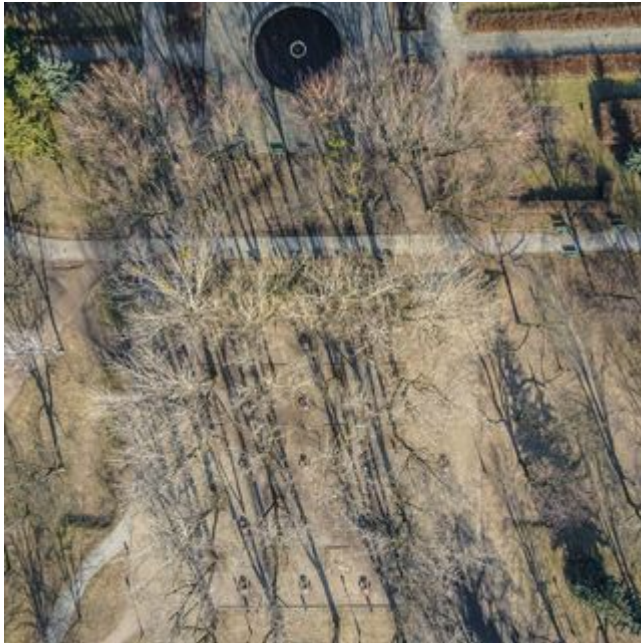
PROJEKT 4 - PARK STAROMIEJSKI REWITALIZACJA OBSZAROWA CENTRUM ŁÓDZI