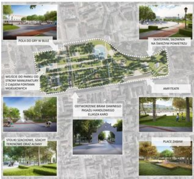
WIZUALIZACJA ZMIAN NA WYKONANE PRACOWNIKÓW FUNKCJONALNOŚĆ - 02/01/2015 3 2015