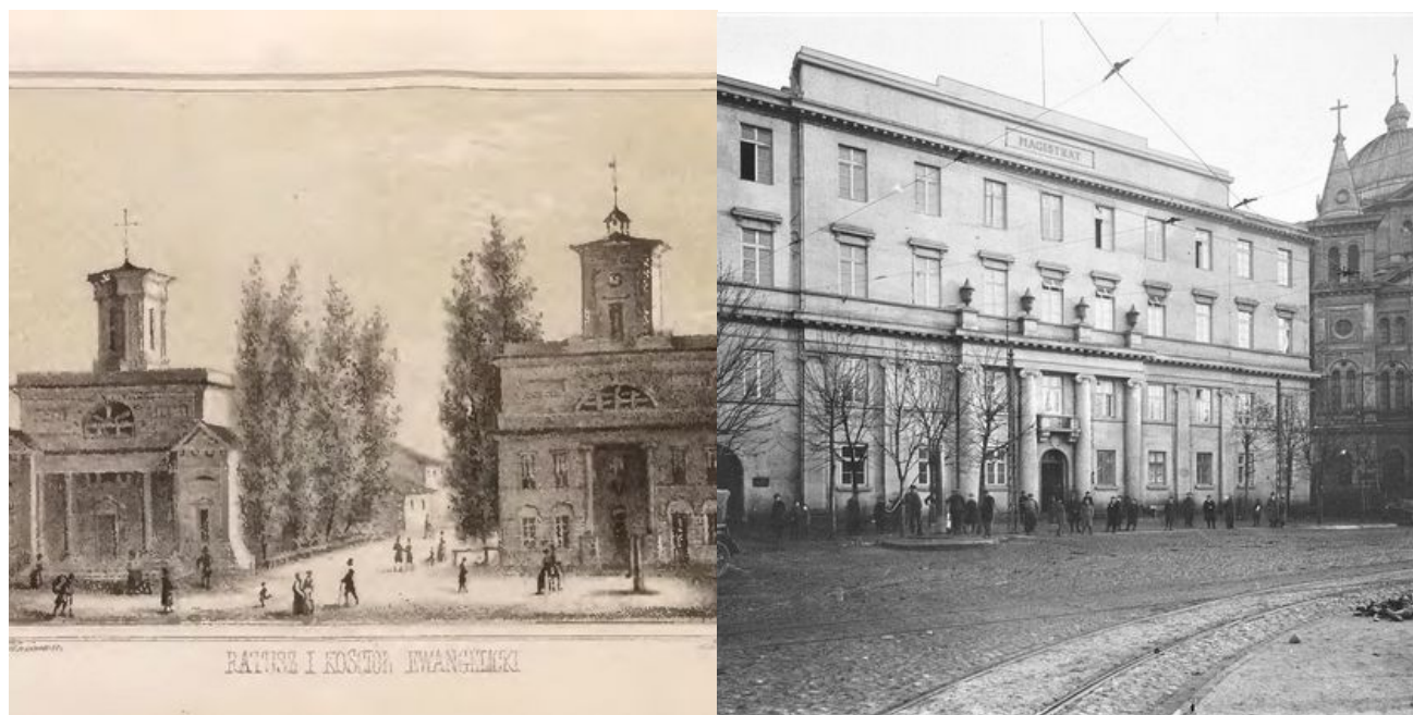
Plac Wolności po 1918 r., archiwum

Wizerunki studni z placu Wolności bez trudu odnajdziemy na starych zdjęciach Łodzi, pocztówkach z przełomu XIX i XX wieku. Ujęcia wody zaznaczone są też na starych mapach. W archiwach Zakładu Wodociągów i Kanalizacji w Łodzi zachowały się również plany z naniesioną dokładną lokalizacją wszystkich podziemnych ujęć.