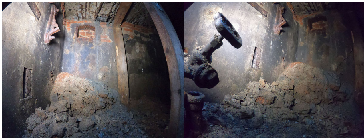
Plac Wolności - komora studni ukryta pod ziemią, ZWiK

Pod placem do dziś zachowały się pozostałości po jednej z tych najstarszych publicznych studni. Jej żeliwny, zdobiony stojak z