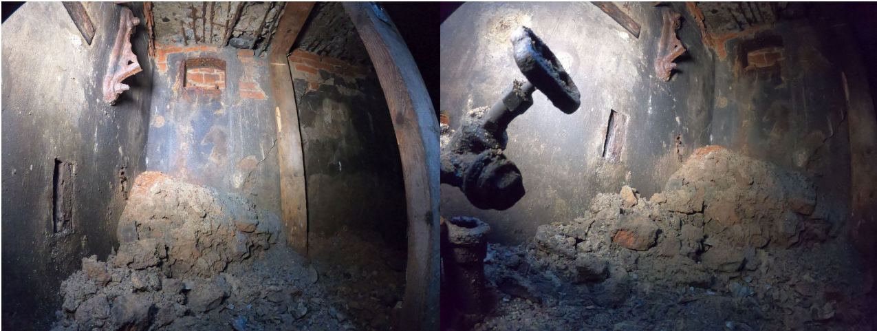
Plac Wolności - komora studni ukryta pod ziemią, ZWiK

Pod placem do dziś zachowały się pozostałości po jednej z tych najstarszych publicznych studni. Jej żeliwny, zdobiony stojak z