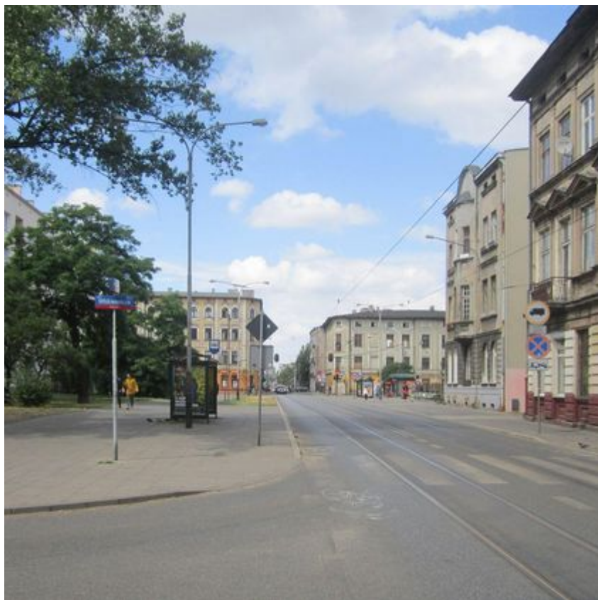
Skwer Kilińskiego - zdjęcie przed zmianami - widok ze skrzyżowania z ul. Rewolucji 1905r.