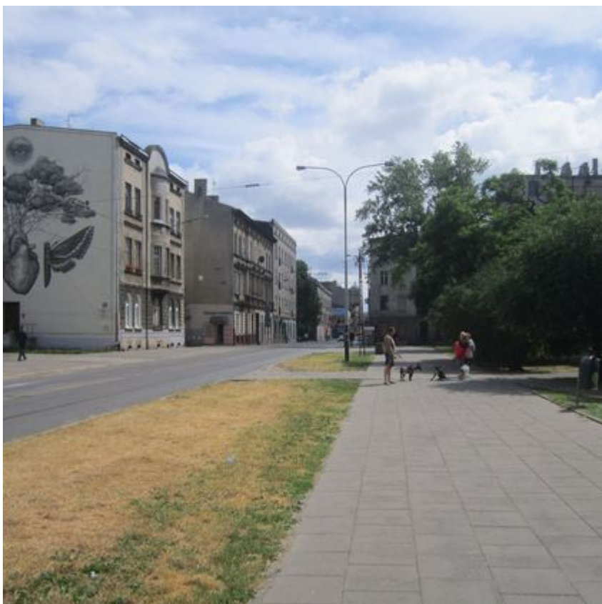
Ten zielony skwer w centrum Łodzi zachwyca. A jeszcze niedawno... [ZDJĘCIA PRZED I PO]