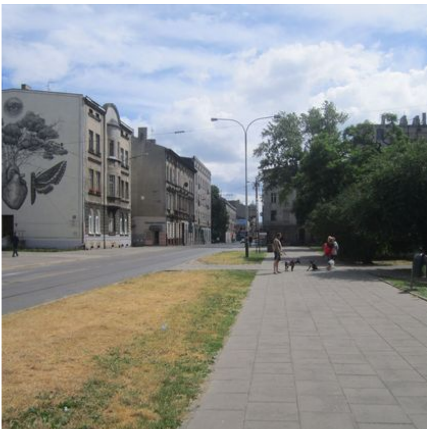
Ten zielony skwer w centrum Łodzi zachwyca. A jeszcze niedawno... [ZDJĘCIA PRZED I PO]