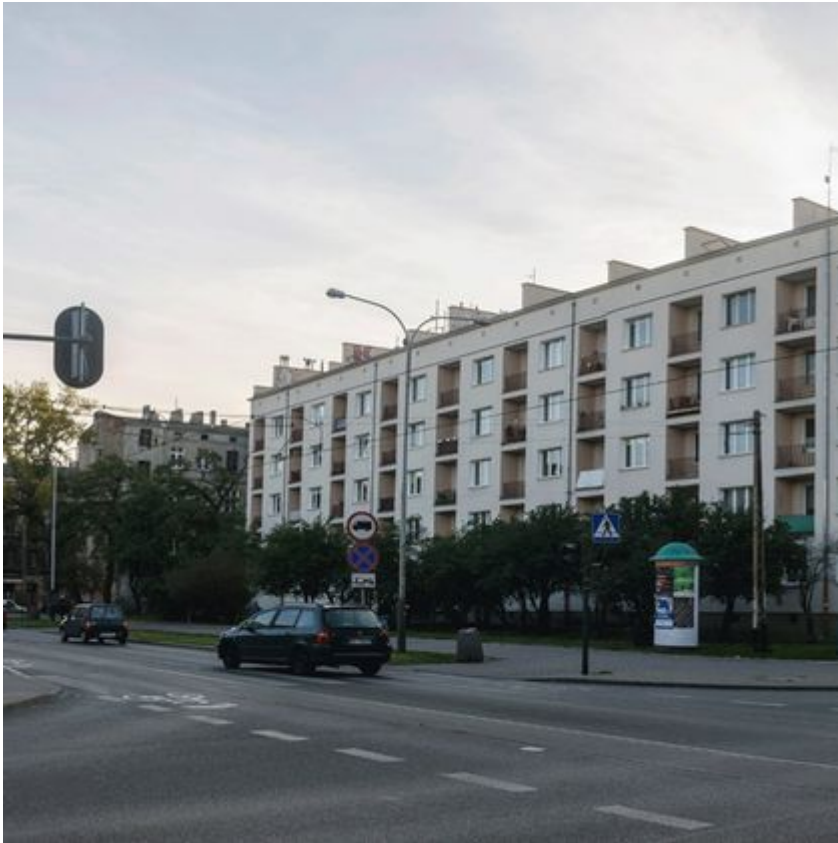
Skwer Kilińskiego - zdjęcie przed zmianami - widok ze skrzyżowania z ul. Rewolucji 1905r.