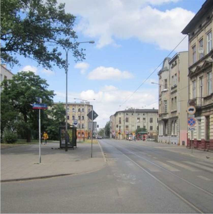
Skwer Kilińskiego - zdjęcie przed zmianami - widok ze skrzyżowania z ul. Rewolucji 1905r.