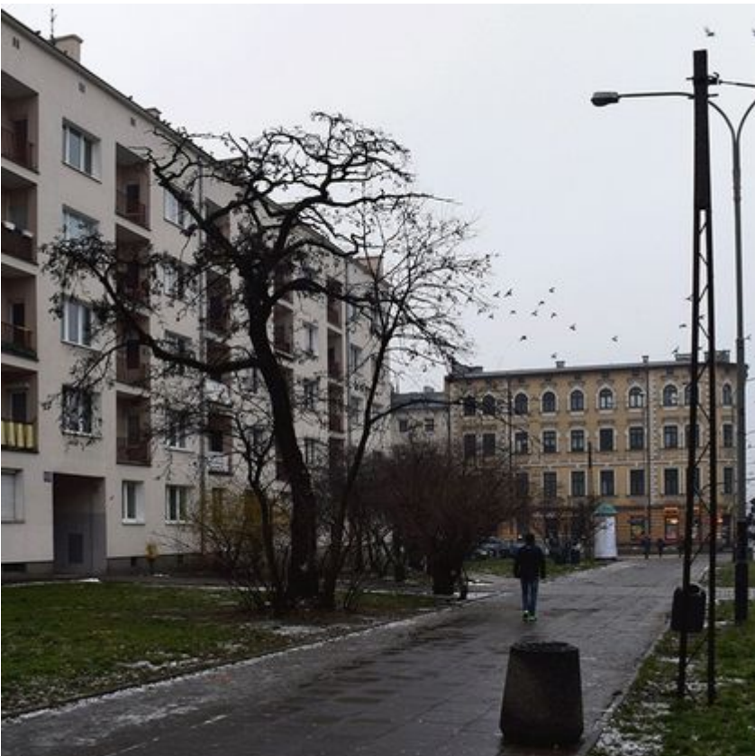
Ten zielony skwer w centrum Łodzi zachwyca. A jeszcze niedawno... [ZDJĘCIA PRZED I PO]