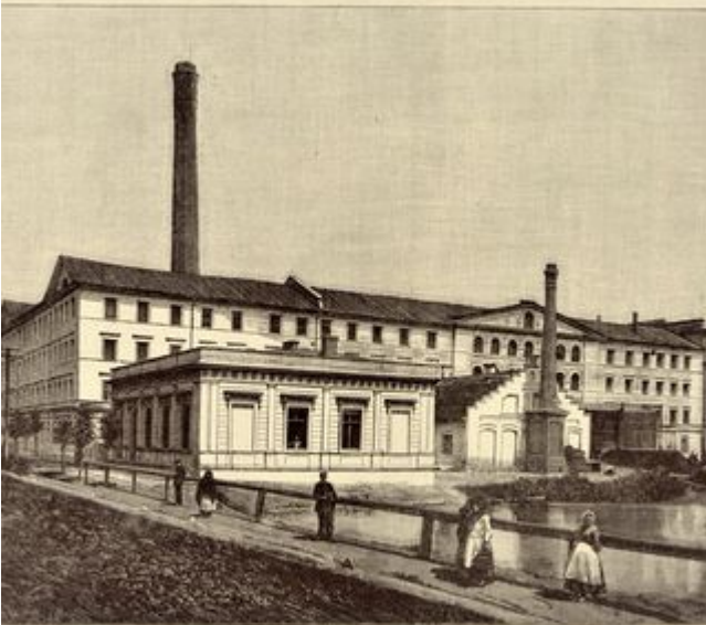
РОССИЙСКОЕ ОБЩЕСТВО ПРЯЖЕНЫХЪ МАШИНЪ „ЛУИ ГИЕРЪ“ въ ЛОДЗИ. — ACTIEN - GESELLSCHAFT der BAUMWOLL - MANUFACTUR LOUIS GUYER, LODZ Бѣльняхъ, апаратура и красильныхъ. — Heilich, Druckerel und Färberei. 2. Продавчихъ и ткачихъ. — Spinnerei und Weberei