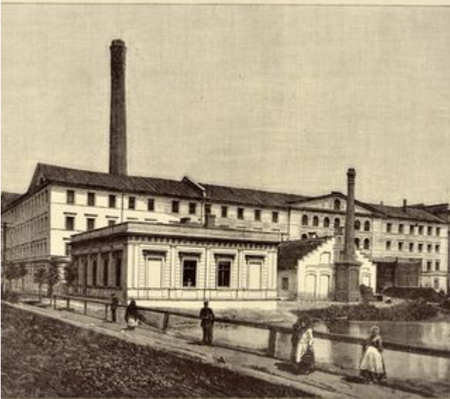
РОССИЙСКОЕ ОБЩЕСТВО ПУМАЖЕНАХЪ МАНУФАКТУРЪ „ЛУИ ГИЕРЪ“ въ ЛОДЗИ. — ACTIEN - GESELLSCHAFT der BAUMWOLL - MANUFACTUR LOUIS GUYER, LODZ Бѣльняхъ, апаратура и красильныхъ. — Heilich, Druckerel und Färberei. 2. Продавчихъ и ткачихъ. — Spinnerei und Weberei