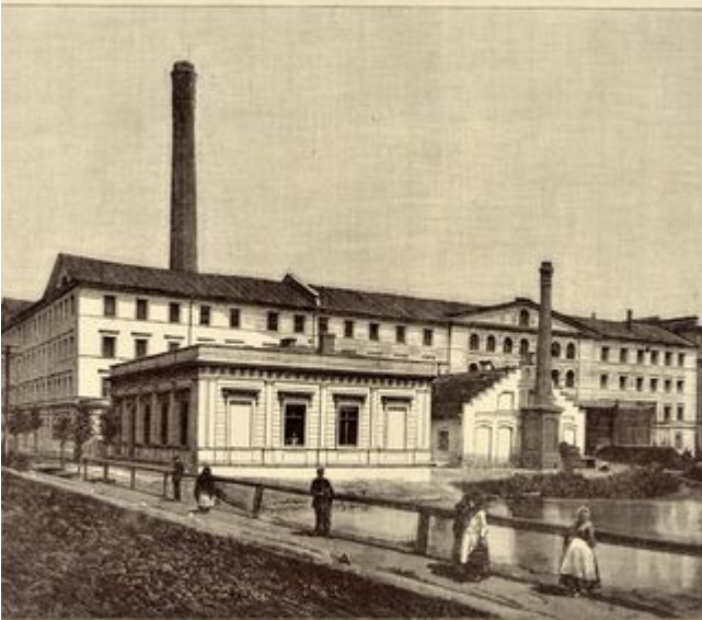
РОССИЙСКОЕ ОБЩЕСТВО БУМАЖНЫХЪ МАШИНАРЪ „ЛУИ ГИЕРЪ“ въ ЛОДЗИ. — ACTIEN - GESELLSCHAFT der BAUMWOLL - MANUFACTUR LOUIS GUYER, LODZ Бумажная фабрика и прядильня. — Heicha, Druckeri und Fäberei. 2. Прядильня и ткацкая. — Spinnerei und Weberei