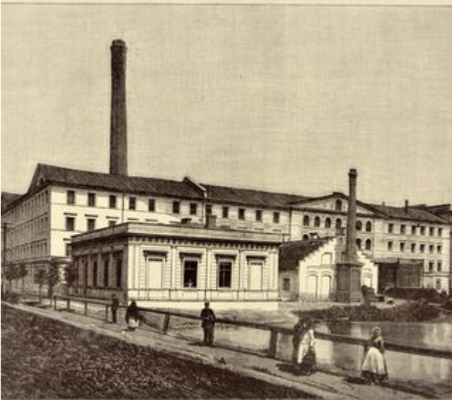
РОССИЙСКОЕ ОБЩЕСТВО БУМАЖНЫХЪ МАШИНАРЪ „ЛУИ ГИЕРЪ“ въ ЛОДЗИ. — ACTIEN - GESELLSCHAFT der BAUMWOLL - MANUFACTUR LOUIS GUYER, LODZ Бумажная фабрика и прачечная. — Heide, Drucker und Fäbberel. 2. Продажная и ткацкая. — Spinnerei und Weberei