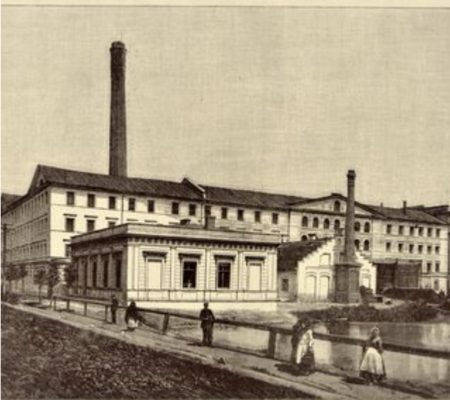
РОССИЙСКОЕ ОБЩЕСТВО БУМАЖНЫХЪ МАНИФАКТУРЪ „ЛУИ ГИЕРЪ“ въ ЛОДЗИ. — ACTIEN - GESELLSCHAFT der BAUMWOLL - MANUFACTUR LOUIS GUYER, LODZ Бумажная фабрика и прядильня. — Heicha, Druckerel und Fäbberel. 2. Прядильня и ткацкая. — Spinnerei und Weberei