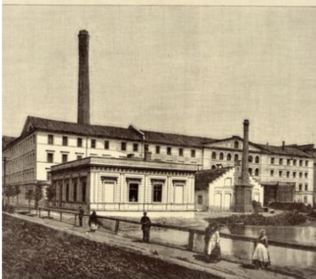
РОССИЙСКОЕ ОБЩЕСТВО ПУМАЖЕННЫХ МАШИНАРИЙ „ЛУИ ГИЕРЪ“ въ ЛОДЗИ. — ACTIEN - GESELLSCHAFT der BAUMWOLL - MANUFACTUR LOUIS GUYER, LODZ Белье, апаратура и красильня. — Heilich, Druckerel und Färberei. 2. Продавцы и ткальи. — Spinnerei und Weberei