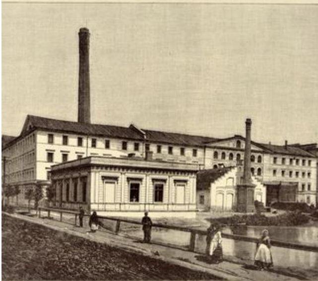
РОССИЙСКОЕ ОБЩЕСТВО БУМАЖНЫХЪ МАНИФАКТУРЪ „ЛУИ ГИЕРЪ“ въ ЛОДЗИ. — ACTIEN - GESELLSCHAFT der BAUMWOLL - MANUFACTUR LOUIS GUYER, LODZ Бумажная фабрика и прядильня. — Heicha, Druckerel und Fäbberel. 2. Прядильня и ткацкая. — Spinnerei und Weberei