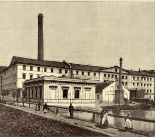
РОССИЙСКОЕ ОБЩЕСТВО БУМАЖНЫХЪ МАШИНАРЪ „ЛУИ ГИЕРЪ“ въ ЛОДЗИ. — ACTIEN - GESELLSCHAFT der BAUMWOLL - MANUFACTUR LOUIS GUYER, LODZ Бумажная фабрика и прядильня. — Heicha, Druckeri und Fäbrikeri. 2. Прядильня и ткацкая. — Spinnerei und Weberei