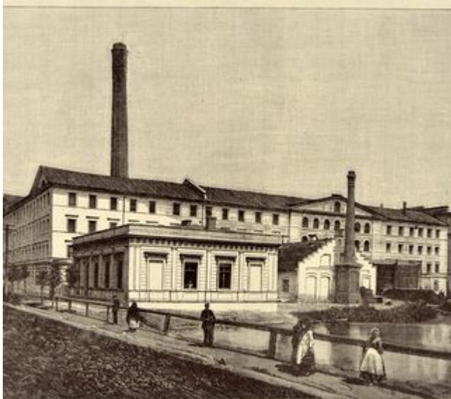
РОССИЙСКОЕ ОБЩЕСТВО ПУМАЖЕННЫХ МАШИНОСТРОИТЕЛЬНЫХ «ЛУИ ГИЕРЪ» въ ЛОДЗИ. — ACTIEN - GESELLSCHAFT der BAUMWOLL - MANUFACTUR LOUIS GUYER, LODZ Белье, апаратура и красильня. — Heilich, Druckerel und Färberei. 2. Продавцы и ткальи. — Spinnerei und Weberei