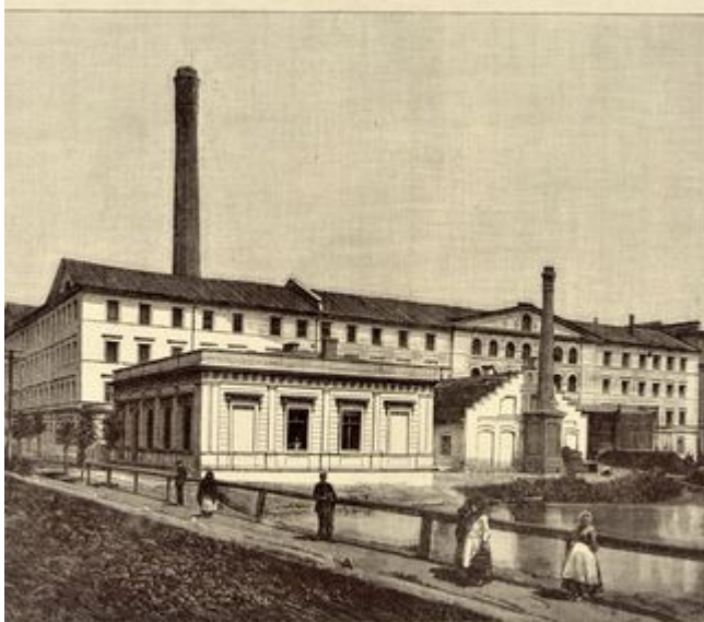
РОССИЙСКОЕ ОБЩЕСТВО ПУМАЖЕННЫХ МАНИФАКТУРЪ „ЛУИ ГИЕРЪ“ въ ЛОДЗИ. — ACTIEN - GESELLSCHAFT der BAUMWOLL - MANUFACTUR LOUIS GUYER, LODZ Бѣльняхъ, апаратура и красильныхъ. — Heilich, Druckerel und Färbereel. 2. Продавцовъ и ткальяхъ. — Spinnereel und Webereel