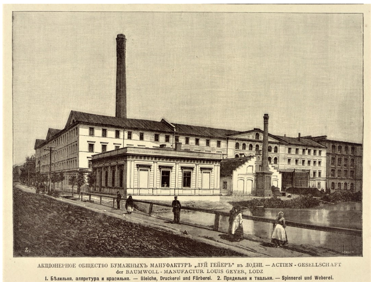
АКЦИОНЕРНОЕ ОБЩЕСТВО БУМАЖНЫХЪ МАНУФАКТУРЪ „ЛУЙ ГЕЙЕРЪ“ ВЪ ЛОДЗИ. — ACTIEN - GESELLSCHAFT der BAUMWOLL - MANUFACTUR LOUIS GEYER, LODZ 1. Бѣлильня, аппретура и красильня. — Bleiche, Druckerei und Färberei. 2. Прядильня и твальня. — Spinnerei und Weberei.

Idąc Piotrkowską od strony pl. Wolności, przed skrzyżowaniem