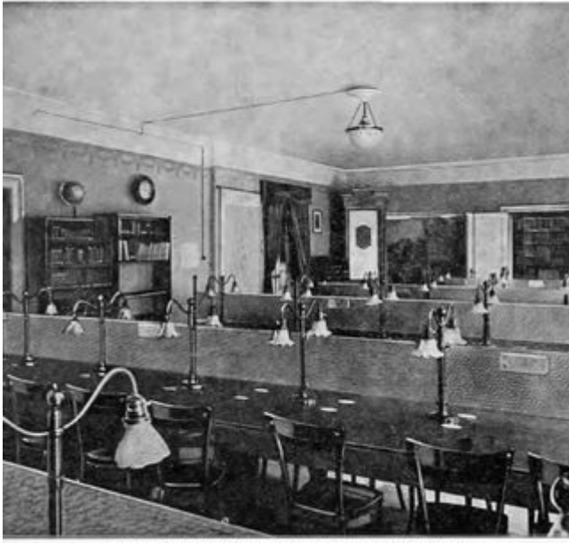
Miejaka Biblioteka Publiczna przy ul. Andrzeja 14 (Czytelnia)