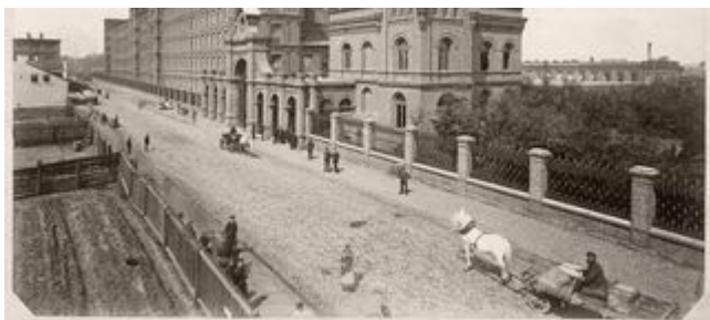
WIDOK NA PODKOŃCIE 1898 r.