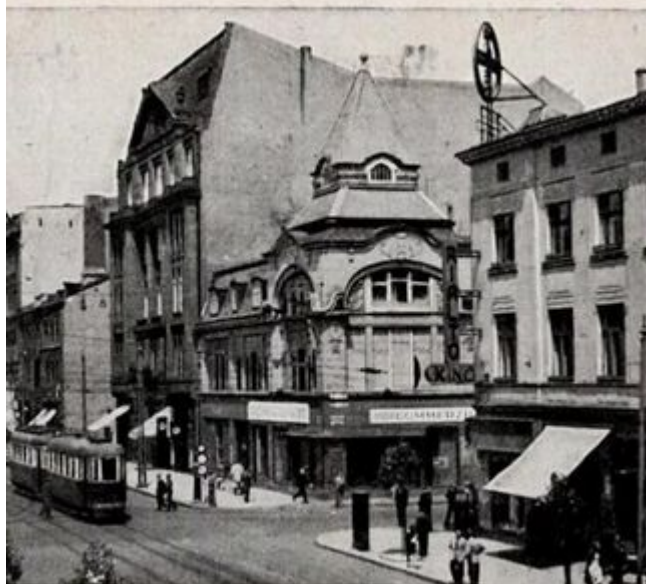
Ecke Adolf-Hitler- und Meisterhaus-Straße