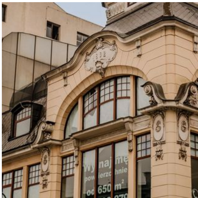
Łódź. Róg Piotrkowskiej i Przejazdu