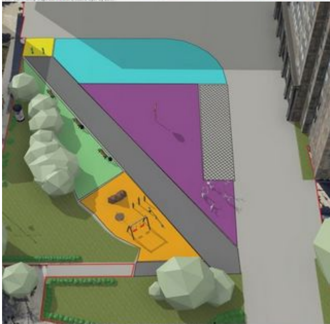
© 2014 Esri. All rights reserved. Esri, the Esri logo, ArcGIS, and ArcGIS Online are either registered trademarks or trademarks of Esri in the United States and/or other countries. Microsoft, Google, and Bing are either registered trademarks or trademarks of Microsoft Corporation in the United States and/or other countries. All other marks contained herein are the property of their respective owners.