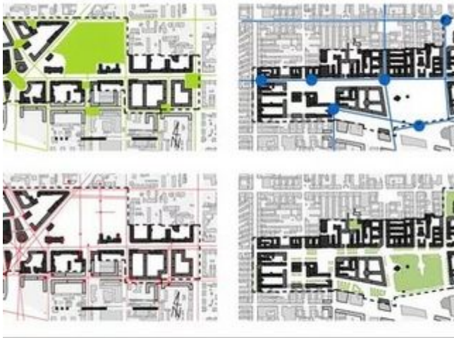
ULICZA W ŁODZI PROJEKTOWANYCH (OD LEWEJ): SYSTEMU PRZESTRZENI PUBLICZNYCH, TRANSPORTU ZBIO