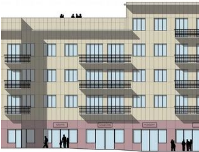
NA PRZYKŁADZIE ULICY NARUTOWICZA W ŁODZI BRYKONOWANEGO BUDYNKU WISŁORÓCZYNIEGO