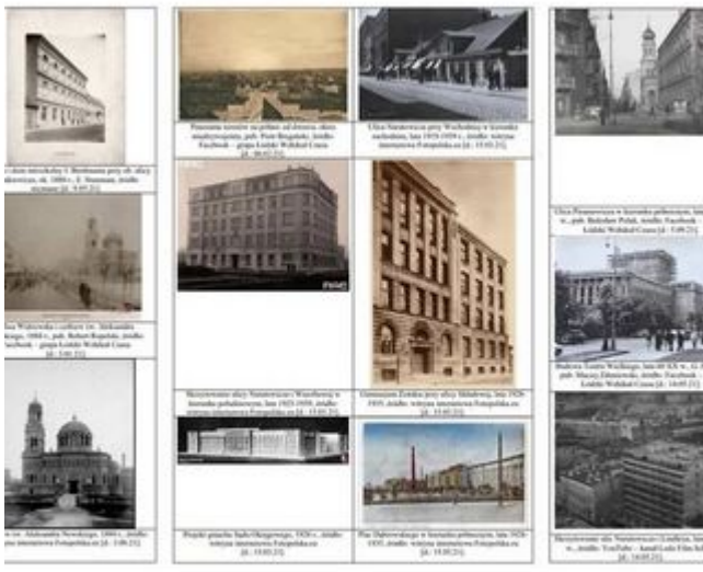
CIĘŻE ŁAJCZY NARUTOWICZA W ŁODZI IKI I MATERIAŁY ARCHIWALNE Z ŁĄCZNE ZGROMADZONYCH PONAD 150 SZTUK NA POTRZEBY REKONSTRUKCJI PRZEBIEGU EWOLUCJI