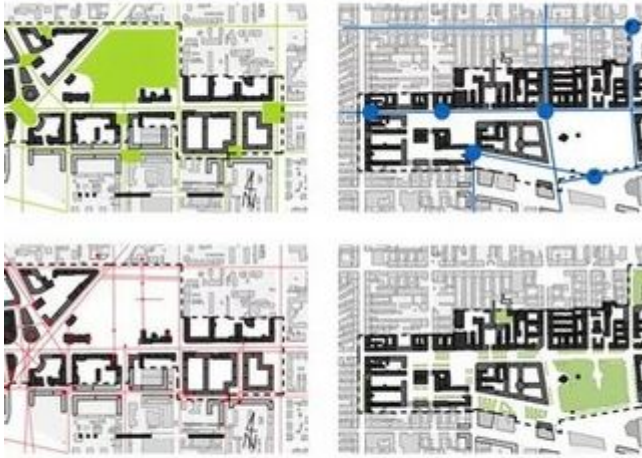
UCZEA W ŁODZI PROJEKTOWANYCH (OD LEWEJ): SYSTEMU PRZESTRZENI PUBLICZNYCH, TRANSPORTU ZBIO