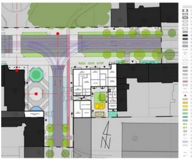
WYKŁADZIE ULICY NARUTOWICZA W ŁODZI MORFOTEKTONICZNO-URBANISTYCZNA