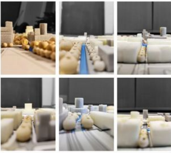
EWOLUCJA PRZESTRZENI NA PRZYKŁADZIE ULICY NARUTOWICZA W ŁODZI ZDJEŃCIA MAKIETY: WYBRANE WIDOKI, DOHRYNANTY I OTWARCIA URBANISTYCZNE