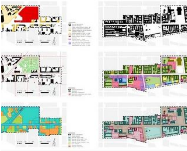
SCZTA W ŁODZI POZYCJI I WŁAŚNOŚCI ORAZ SUMA SZWARPLANÓW, POOSUMOWANIE ANALIZ I WALORYZACJA ORAZ WYTYCZNE PROJEKTU