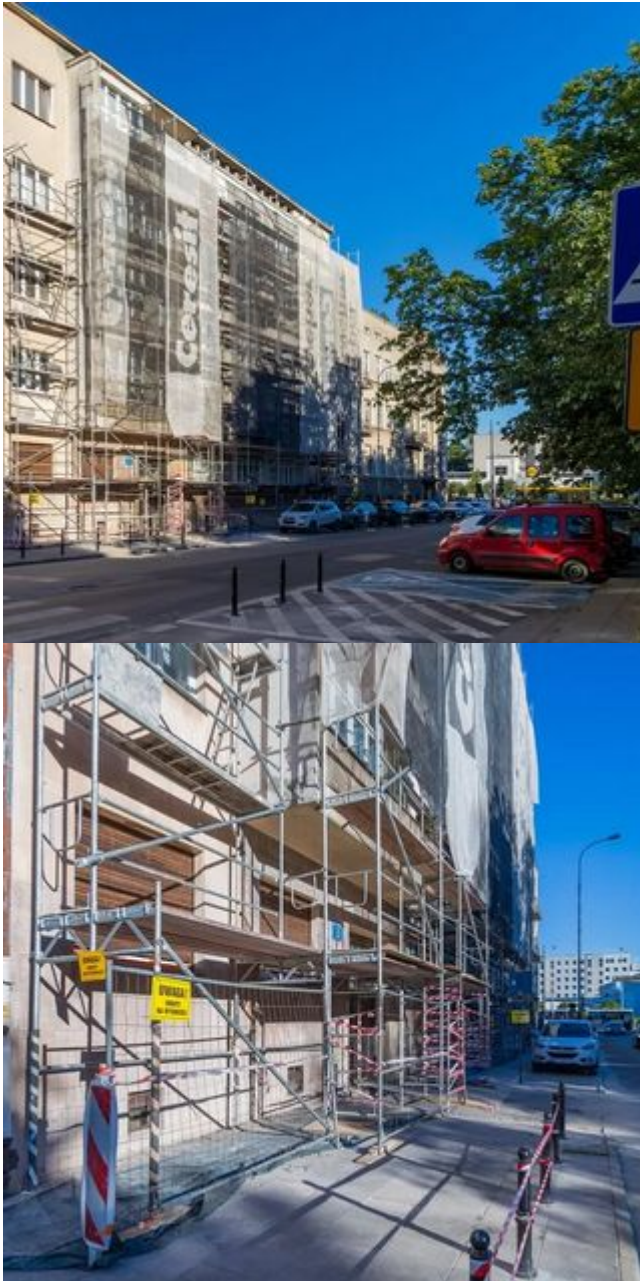
Perełka modernizmu przy Anstadta do remontu. Skryła się już za rusztowaniami