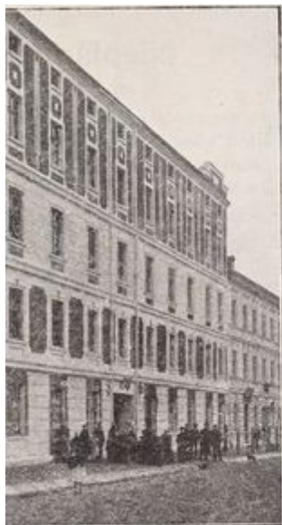
Łodzi przy ul. Przędzalnianej 18.