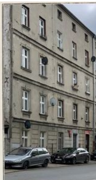
Kamienica w Łodzi przy ul. Przędzalnianej 18.